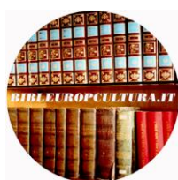
Biblioteca Europea di Cultura "Victor Del Litto"